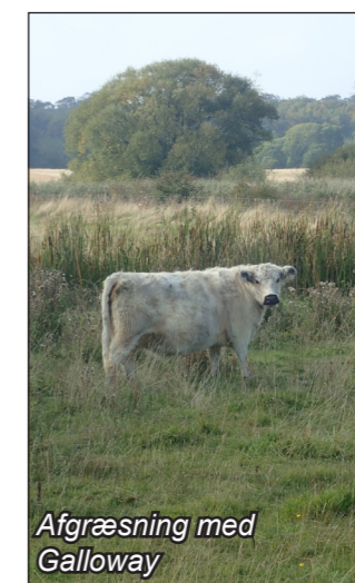
Afgræsning med Galloway

Projektet finansieres af EU, VILLUM FONDEN og Kerteminde Kommune og gennemføres i et samarbejde mellem lodsejer og Kerteminde Kommune. Projektet løber frem til juni 2018.