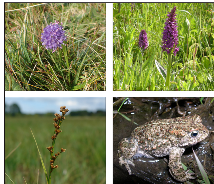
Øverst TV: Djævelsbid; TH: Maj Gøgeurt Nederst TV: Hvas Avneknippe; TH: Strandtudse

Området bliver ekstensivt afgræsset med kreaturer af racen Galloway.