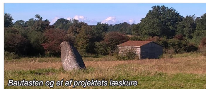
Bautasten og et af projektets læskure

Et andet formål med projektet er at forbedre yngleforhold og levevilkår for strandtudsen ved at lave 5 mindre vandhuller.