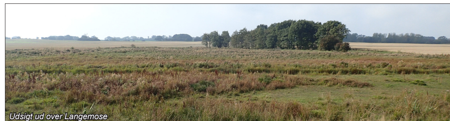
Udsigt ud over Langemose

Det er i dag muligt at besøge området ved at køre ad vejen Stengårds Stænge fra Måle. Herfra kan området opleves fra en sti langs stranden. Der er ingen offentlig adgang til de indhegnede områder uden forudgående tilladelse fra lodsejeren.